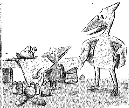
ภาพการจัดระเบียบของใช้ในห้องเรียน

ทุกเช้าแม่จะปลุกให้ตื่นได้ก็แสนลำบากยากเย็น “เป็บป๊าบ! ตื่นได้แล้วลูก เตรียมไปโรงเรียนเลย” แม่ต้องเรียกเป็นสิบๆครั้ง เขาจึงจะยอมลุก “ดูสิ! รื้อของเล่นรกรกเต็มห้องอีกแล้ว ต่อไปนี้ แม่จะไม่กับในนี้แล้วนะ” แม่พูดเห็นแงดู